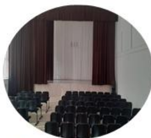
Актовый зал- 150/198,4 м 2