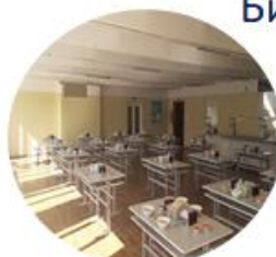
Столовая - 120/170 м 2 (имеет собственный штат работников)