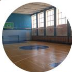
Спортивный зал- 273 м 2